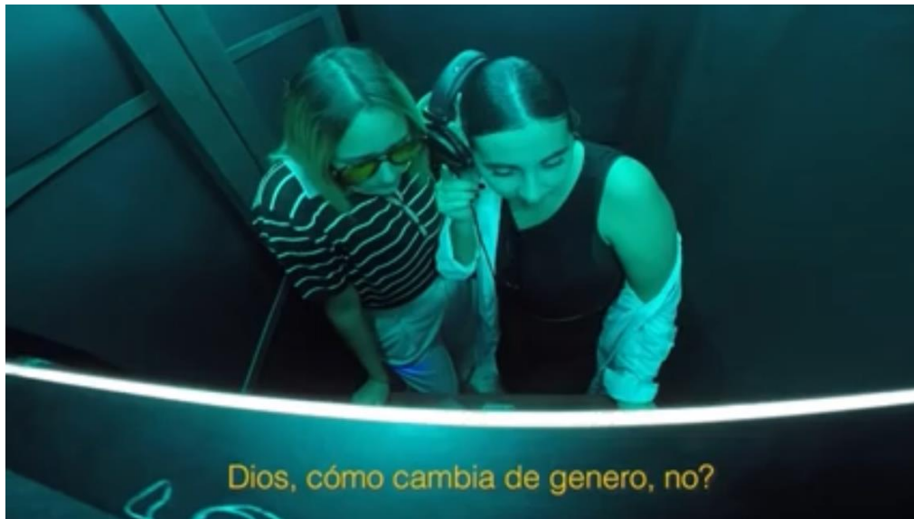
Captura del Trailer Session #51 Villano Antillano

los oyentes entrando en la cabina. Todas estas imágenes circularon como forma de promoción del tema que rápidamente se convirtió en un éxito con 140 millones de reproducciones en Youtube.