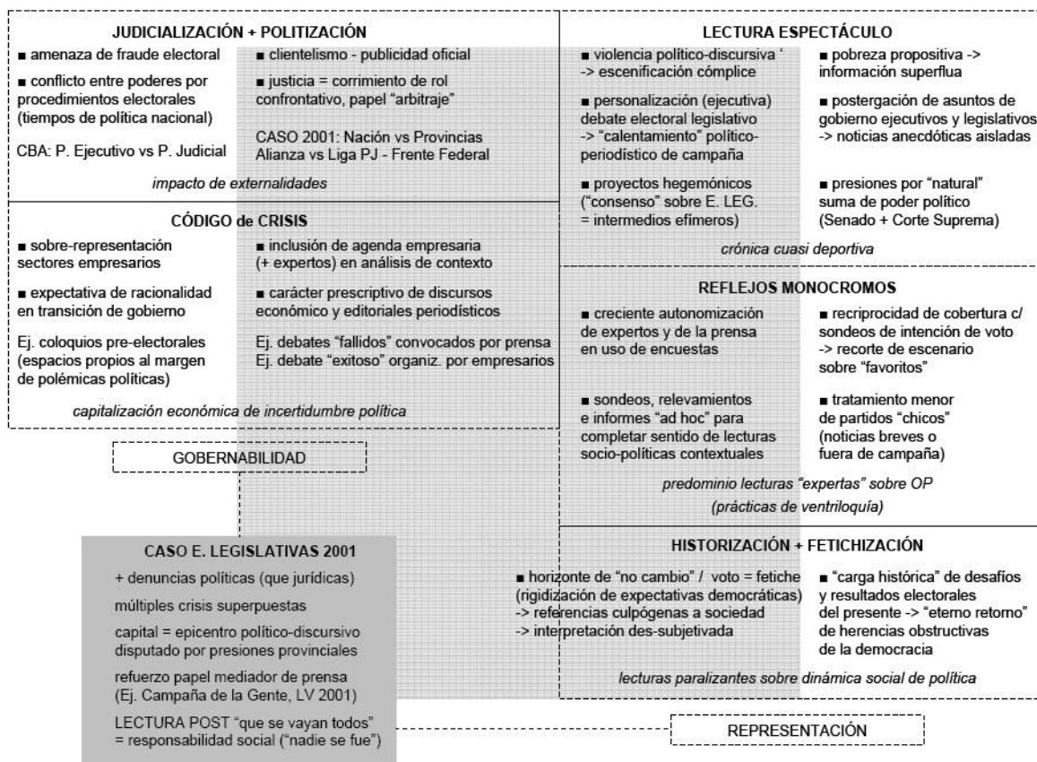
Gráfico N° 1 – 5 categorías temáticas de cobertura electoral (1999-2005)