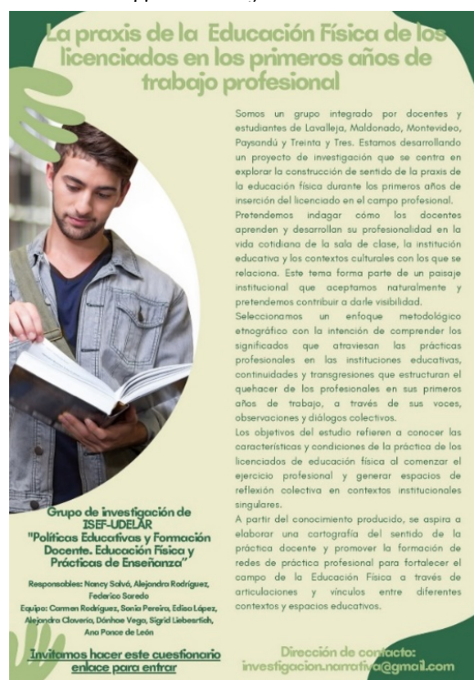
Figura 1 Folleto digital de difusión

En nuestro trabajo, la comunidad de investigación desarrolla su praxis profesional en diferentes localidades y diferentes instituciones. De ahí que la dispersión institucional y territorial de los posibles participantes fue un obstáculo para iniciar el trabajo de campo que resolvimos a través de un poster de difusión, invitando a participar con enlace a un formulario online. El análisis de los datos que aportan las observaciones, voces, imágenes y narraciones dan sentido a una etnografía a partir de esta triangulación teórica, de fuentes y de actores. Los datos que aporta el formulario conforman un primer acercamiento a la población objetivo de carácter exploratorio. Por un lado, permite acceder a informaciones básicas para elaborar una cartografía del campo de la praxis de la educación física de licenciados principiantes y, por otro, aporta la nómina de posibles participantes para construir la muestra (quienes expresaron su voluntad de participar) para continuar la investigación.